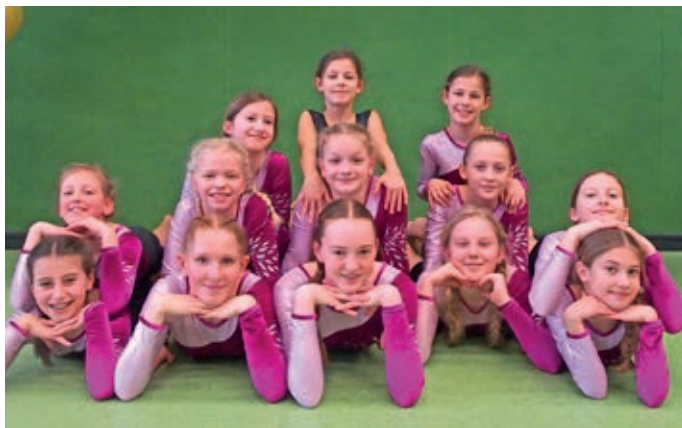
Iburger Turnerinnen: Charmant und erfolgreich.

Die Organisatoren der Veranstaltung lösten die Herausforderung, unterschiedlichste Wettkämpfe mit verschiedenen Gerätenforderungen in nur vier Durchgänge zu planen, gekonnt. Die nächsten zwei Wochen stehen beim TV Bad Iburg unter dem Motto intensives Training, um das erreichte Leistungsniveau zu halten und möglicherweise sogar einzelne B-nuselemente hinzuzufügen. ●