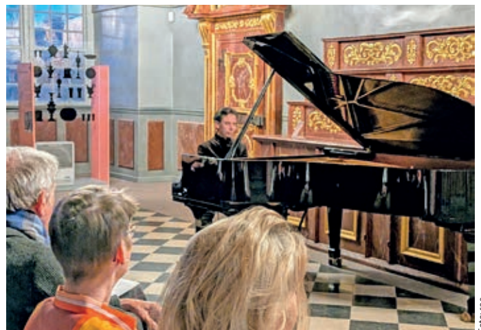
Martin Stadtfeld begeistert im Rittersaal der Iburg.

sche Suite Nr. 5 in G-Dur erklang mit einer Klarheit und Natürlichkeit, die sofort in den Bann zog. Stadtfelds Bach-Spiel zeichnet sich durch eine besondere Qualität aus: Die Musik wirkt unmittelbar, fast meditativ. In seinen Händen entfalten einfache Harmonien plötzlich universelle Dimensionen. Jede der sieben Tanzsätze – von der Allemande über Courante, Sarabande und Gavotte bis zur schwungvollen Gigue – erhielt ihren eigenen Charakter, fügte sich aber zugleich in ein stimmiges Ganzes. „Musik steht für Menschlichkeit, für Trost und Hoffnung, aber auch für die ständige Auseinandersetzung mit uns selbst“, hat Stadtfeld einmal über sein Bach-Verständnis gesagt. Genau das