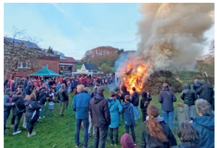
Das Osterfeuer wärmte die Besucherinnen und Besucher.

kind ausgelost. Mit den Einnahmen finanziert der Verein unter anderem die vereinseigene Instrumentalausbildung für seine Mitglieder. Diese kann dadurch kostenlos, auf hohem Niveau und inklusive Instrument angeboten werden. ●