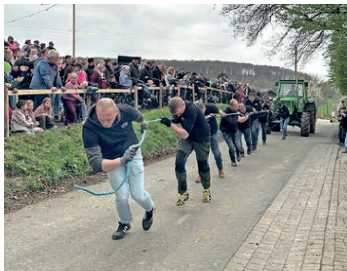
Die Landjugend Sudenfeld zog mit aller Kraft den Traktor über die Straße – und schaffte es auf Platz zwei.

werb, in dem mehrere Teams gegeneinander antreten, gewinnt die Mannschaft, die einen Traktor in der kürzesten Zeitspanne ins Ziel bringt. Beim „Frühlingssturm“ der Landjugend Sudenfeld gab es dieses Spektakel wieder zu er-