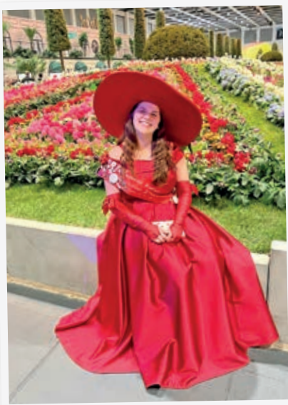
Die Kirschkönigin vor einem Blumenmeer.