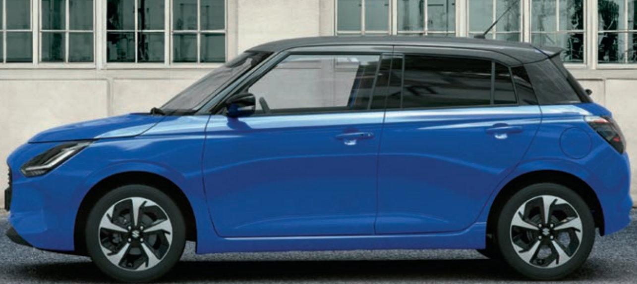
Abbildung zeigt aufpreispflichtige Sonderausstattung. Mehr Informationen zu Ausstattungslinie und Sonderausstattungen finden Sie hier: