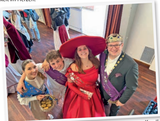
Die anderen Hoheiten waren für Vanessa wie eine Wochenendfamilie.

Mit neuen Leuten ins Gespräch kommen, schöne Fotos schießen oder kleinere Feste als Wochenendausflug besuchen, sind Dinge, die ich vermissen werde. Allerdings kann ich sowas auch ohne Krone weiterhin erleben. Aber dieses Gefühl der hoheitlichen Wochenendfamilie wird mir sehr fehlen. Denn diese Gemeinschaft aufrechtzuerhalten ist wesentlich schwieriger, wenn jeder wieder im eigenen Alltag angekommen ist.