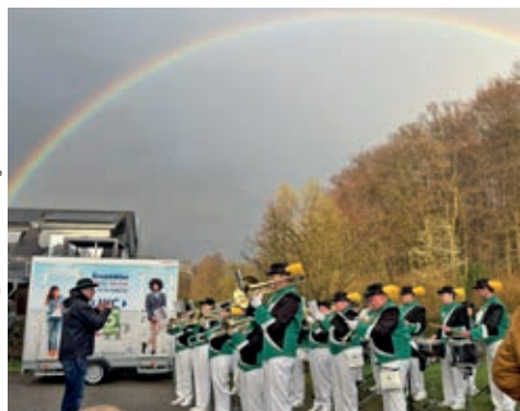
Der Musikverein „Wiesental“ läutete die Veranstaltung musikalisch ein.

Für das leibliche Wohl sorgten erneut die „Boten