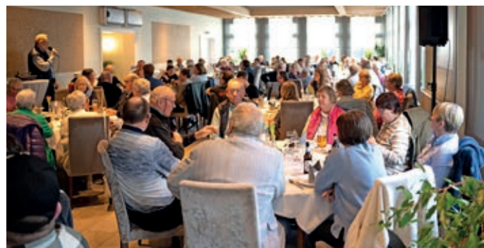
Der Saal im Restaurant zum Forellental war bei der Jahresmitgliederversammlung des VFB voll.

und die Schwimmgruppe stellten mit vielen Fotos und Berichten die Aktionen des letzten Jahres und den Ausblick auf das aktuelle Jahr vor. Jeweils alle zwei Wochen am Samstag veranstaltet das Aktiv-Team unterschiedliche Aktionen von Bastelaktionen über Zoobesuche bis zu gemeinsamen Wanderungen ist alles dabei. Die Schwimmgruppe konnte auch 2025 die sehr beliebten Aktionen Pfingstzeltlager und Herbstfreizeit neben dem wöchentlichen Schwimmen und dem Besuch der Disco Hottendeele anbieten. Ein Highlight war der Rückblick auf die vielen Jubiläumsaktionen wie ein Besuch beim „BINGO!“ in Hannover oder der offizielle Empfang am Hallenbad mit anschließender Party. In diesem Jahr tritt beim VFB erst einmal etwas „Ruhe“ ein. Kein großes Jubiläum, sondern einfach nur die ganz „normalen“ Aktionen wie Pfingstzeltlager, Segeln, Herbstfreizeit, Silvester, die zweiwöchigen Treffen des Aktiv-Teams und natürlich das wöchentliche Schwimmen. 2027 steht dann das nächste Jubiläum an: Das Aktiv-Team feiert seinen 20. Geburtstag. ●