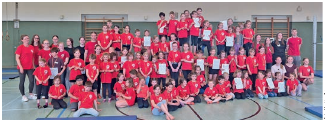
75 Kinder machten beim Turnfest mit.

an insgesamt zwölf Geräten voller Stolz ihr Können. Überall war Bewegung: Es wurde balanciert, gesprungen, geschwungen und geturnt – begleitet von aufgeregtem Lachen und konzentrierten Blicken. Wenn es zum Beispiel beim Tauehochklettern kräftemäßig nicht ganz nach oben ging, wurde eben die nächste Station ausprobiert. Trampolinspringen war da schon angenehmer. Schwebebalken und Barren entpuppten sich nicht unbedingt als Lieblingsgerät der Kinder. Egal! „Hauptsache, es macht allen Spaß. Das ist auch bei unserer Übungsstunde einmal in der