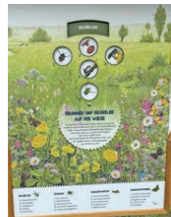
Was krabbelt auf der Wiese? Auch das wird auf dem Naturlehrpfad vermittelt.

Informationen zur elektrischen Reichweite, Energiekosten, Kfz-Steuer und CO 2 -Kosten finden Sie unter www.mazda.de/Energieverbrauch .