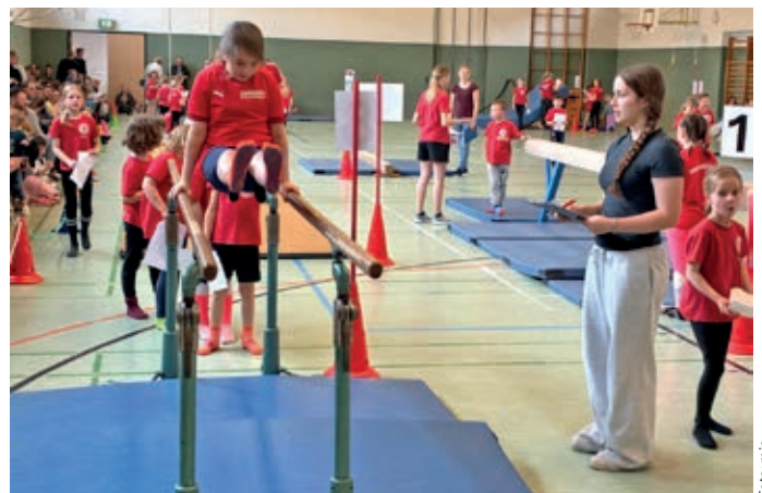
Tolle Stimmung, gute Leistungen: In der Halle der Hagener Grundschule zeigten Mädchen und Jungen ihr Können an insgesamt zwölf Geräten.

Kein Wunder, dass beim Kinderturnfest des Hagener SV eine lebendige und begeisternde Atmosphäre herrschte. In der Halle der Grundschule präsentierten 75 Jungen und Mädchen