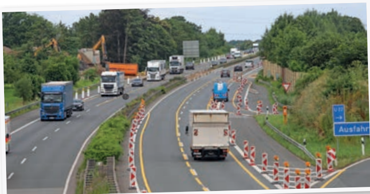
Am Montagvormittag floss der Verkehr wieder ungehindert auf der A30.

her Straße (L91) abgerissen. Die Umleitungen führen in Fahrtrichtung Amsterdam ab Melle-Ost über die U20. In Fahrtrichtung Hannover wird der Verkehr ab Melle-West über die U45 geleitet. Für den Fernverkehr seien bereits ab den Autobahnkreu-