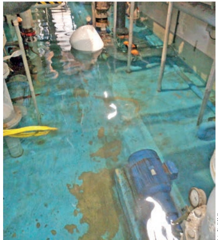
Der jüngste Rückschlag im Wellenfreibad: Der geflutete Kellerbereich machte eine umgehende Schließung erforderlich.

gig geschlossenen Freibad am Samstag. Das alles waren nicht die ersten Baustelle in der Freibadsaison: Aufgrund personeller Engpässe war der Start im Wellenfreibad bereits zwei Wochen nach hinten auf Ende Mai verschoben worden. Ein Defekt an einer Wasserzuleitung neben dem Sportbecken, der umfangreiche Reparaturarbeiten nach sich zog, sorgte für eine weitere Woche Verzögerung. In Riemsloh und Wellingholzhausen war die Saison bereits ebenfalls später gestartet: Wegen krankheitsbedingter Ausfälle und dem Fachkräftemangel beim Aufsichtspersonal hatten die Eröffnungen um jeweils eine Woche verschoben werden müssen. jka ●