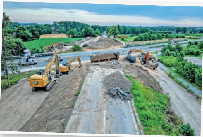
Endet abrupt: Die Allendorfer Straße nach dem Brückenabriss.

hoffen sich alle Beteiligten an diesem Wochenende, wenn die Autobahn von Freitag (22 Uhr) bis Montag (5 Uhr) wieder voll gesperrt wird. Zwischen den Anschlussstellen Melle-Ost und Melle-West wird während dieser Zeit die Brücke der Riemslo-