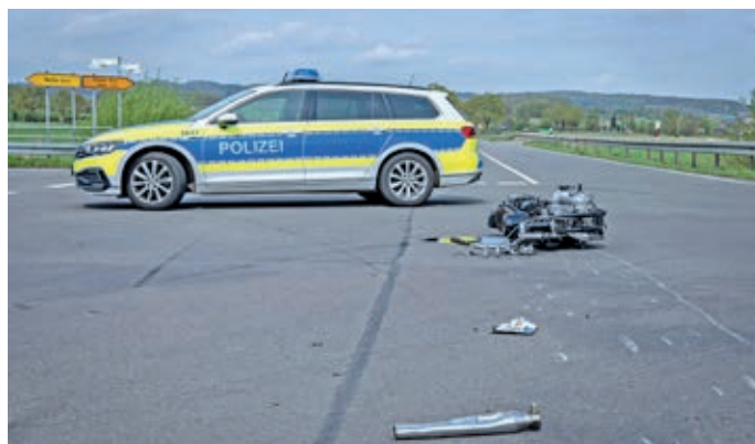
Die Meller Polizei wurde im vergangenen Jahr zu 1.325 Verkehrsunfällen gerufen.

Während bei den E-Scootern die Altersklasse 18 bis 25 Jahre im Fokus steht, lässt sich für E-Bikes ein Schwerpunkt in der Altersklasse ab 65 Jahren feststellen. „Senioren sind aufgrund ihres Alters oft verletzlicher, haben eine längere Reaktionszeit, aber sind im Ruhestand auch einfach mehr mit E-Bikes unterwegs als andere Altersgruppen“, erklärt Dependahl die Statistik. Aufgrund der Geschwindigkeiten, die erreicht werden, seien bei E-Bike-Unfällen regelmäßig schwerere Verletzungsgrade festzustellen. Immerhin: Die Zahl der Unfälle mit Pedelecs sank leicht von 42 (2024) auf 33 (2025).