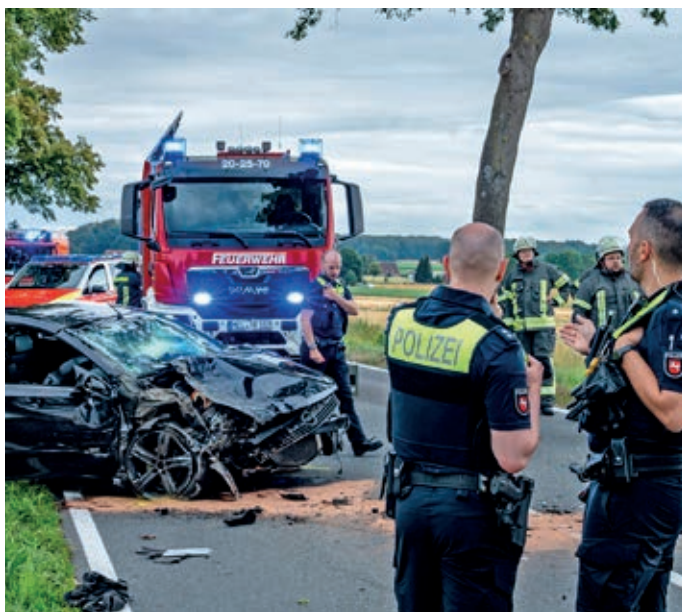
In diesem Unfallfahrzeug saßen zwei junge Männer, die bei dem Zusammenstoß leicht verletzt wurden.

waren. Der Jaguar wurde auf ein Feld geschleudert und blieb auf der Seite liegen. Die drei Insassen konnten sich trotz schwerer Verletzungen aus dem Wagen befreien und wurden in umliegende Krankenhäuser gebracht. Die beiden Insassen des Opel erlitten laut Polizei leichte Verletzungen. Zur Versorgung der Verletzten war unter anderem ein Rettungshubschrauber im Einsatz. Zudem waren Rettungskräfte aus Niedersachsen und Nordrhein-Westfalen sowie mehrere Meller Ortsfeuerwehren im Einsatz. ●