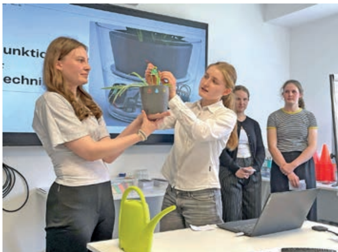
„Die „Ecological Future AG“ überzeugte mit ihrem intelligenten Blumentopf und einem selbst gestalteten Prototyp.“

Telefon 05401/83737-0 anzeigen@osning-medien.de www.osning-medien.de