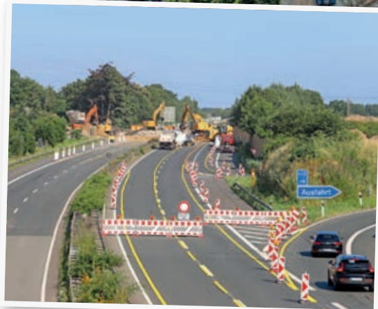
Am Samstagmorgen war der Brückenkörper bereits abgerissen.