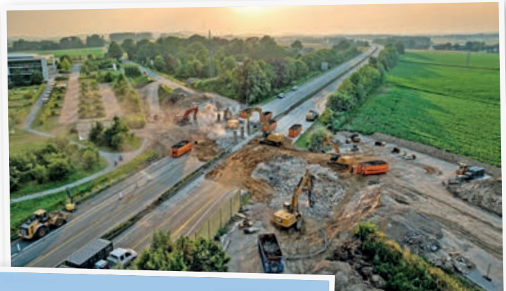
Am Abend des 26. Juni begannen die Arbeiten.