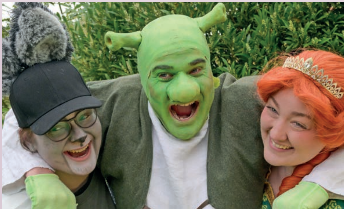
Der Esel, Shrek und Fiona unterhalten Familien in diesem Sommer auf der Waldbühne Kloster Oesede.

„Shrek – Das Musical“ bringt die Waldbühne in der kinderfreundlichen „Theatre for Young Audiences“-Version auf die Bühne. Die Produktion basiert auf dem DreamWorks-Animationsfilm sowie dem Buch von William Steig. Erzählt wird die Geschichte des mürrischen Ogers Shrek, der zurückgezogen in seinem Sumpf lebt. Seine Ruhe wird gestört, als vertriebene Märchenwesen bei ihm Zuflucht suchen, die vom machthungrigen Herrscher verbannt wurden. Um seine Heimat zurückzubekommen, muss Shrek eine Prinzessin aus einem Turm