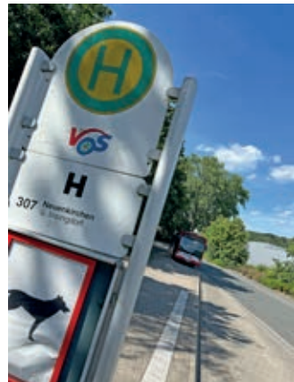
Wie der ÖPNV in Melle ergänzt wird, ist ein Thema, das die Politik noch beschäftigen wird.

CDU-Ratsherr: „Wir machen die Arbeit des Landkreises. Es ist eigentlich schon fast frech, dass man sich beim Landkreis dem Thema verweigert.“ Der Begriff „Lütti“ habe auch in der Meller Lokalpolitik polarisiert und zu mancher Auseinandersetzung geführt, „aber eigentlich wollen wir alle das Gleiche: Einen zukunftsfähigen On-demand-Verkehr.“