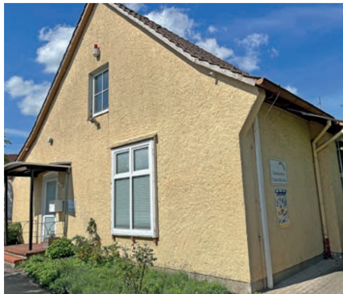
Der Altbau der Grundschule in Eicken-Bruche soll abgerissen werden.

Eine weitere Ausgabe ist schon in Sicht: Der Bebauungsplan für ein neues Feuerwehrgerätehaus in Bruchmühlen wurde im Rat ebenfalls auf den Weg gebracht. jka ●