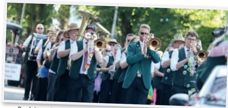
Begleitete das Wochenende musikalisch: Die Heimatkapelle.

Die Proklamation des neuen Schützenkönigs und der Königsball waren am Montag erst nach Druckschluss dieser Ausgabe terminiert. jka ●