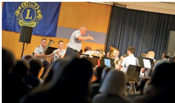
Das Luftwaffenmusikkorps Münster spielte vor rund 500 Gästen im Meller Forum.

Am 15. Dezember spielt das Luftwaffenmusikkorps Münster in voller Besetzung ein weiteres Benefizkonzert in der Christophoruskirche in Neuenkirchen. „Wir freuen uns auf das Konzert in der Vorweihnachtszeit, das durch eine ganz andere, festlich geprägte Musikauswahl einen eigenen Charakter haben wird“, blickt Ehlers voraus. Der Erlös ist dann der Jungbläserausbildung und dem Förderverein des örtlichen Posaenchores zugute. Karten sind bereits im Vorverkauf erhältlich. jka ●